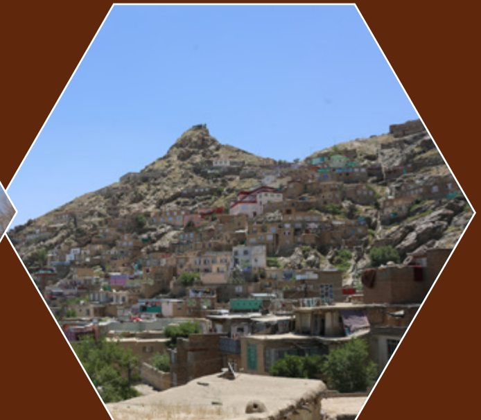
ساحات غیررسمی شهری کابل