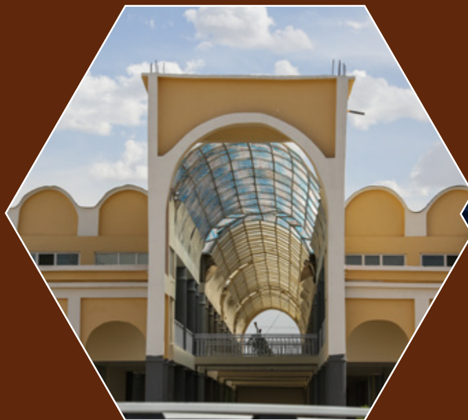
مرکز ثقافت اسلامی در ولایت غزنی