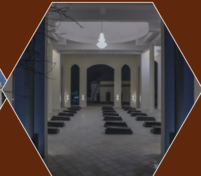
بنای یاد بود شهدای پارلمان