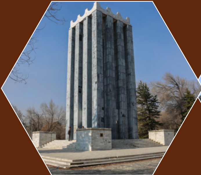
ترمیم و مرمت مقبره سید جمال‌الدین افغان