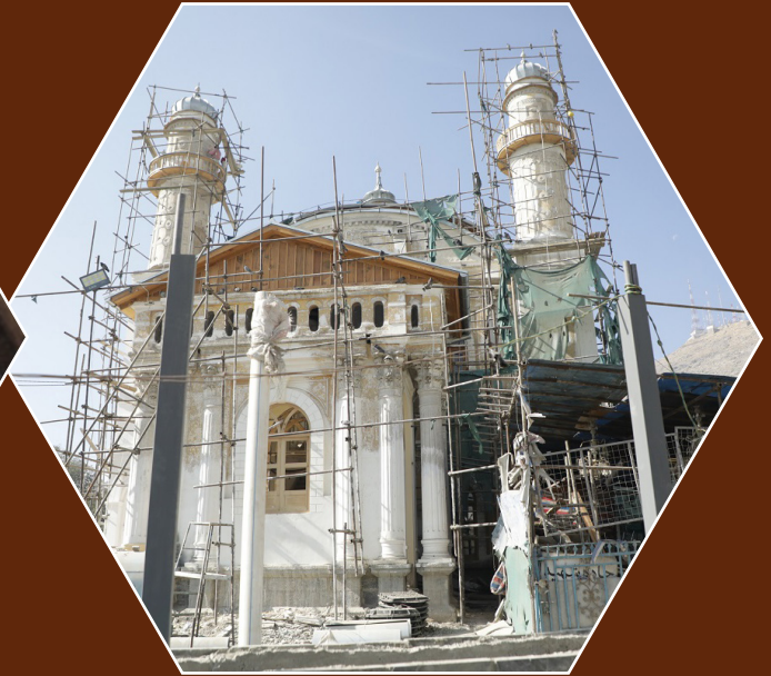
ترمیم و بازسازی مسجد شاه دوشمشیره