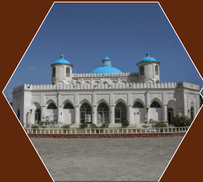
قصر باغ بالا در کابل