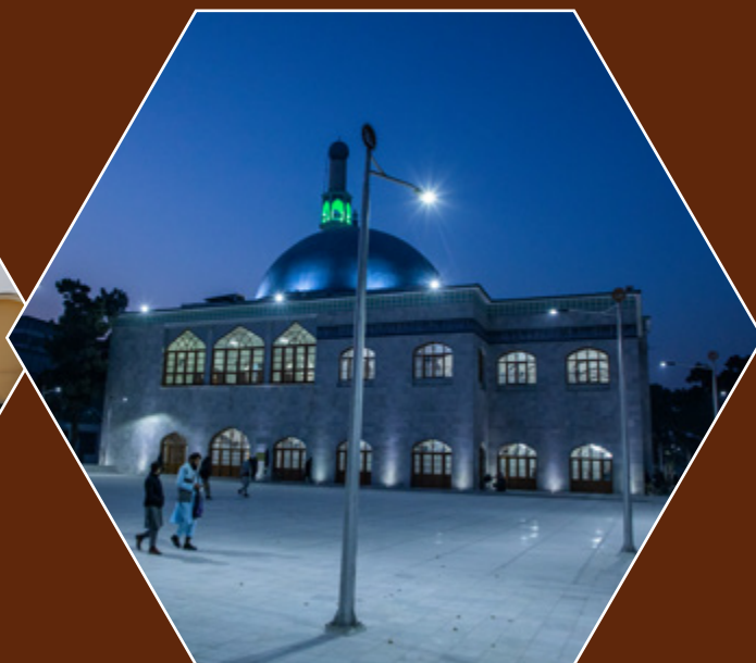
مسجد جامع پل خشتی در کابل