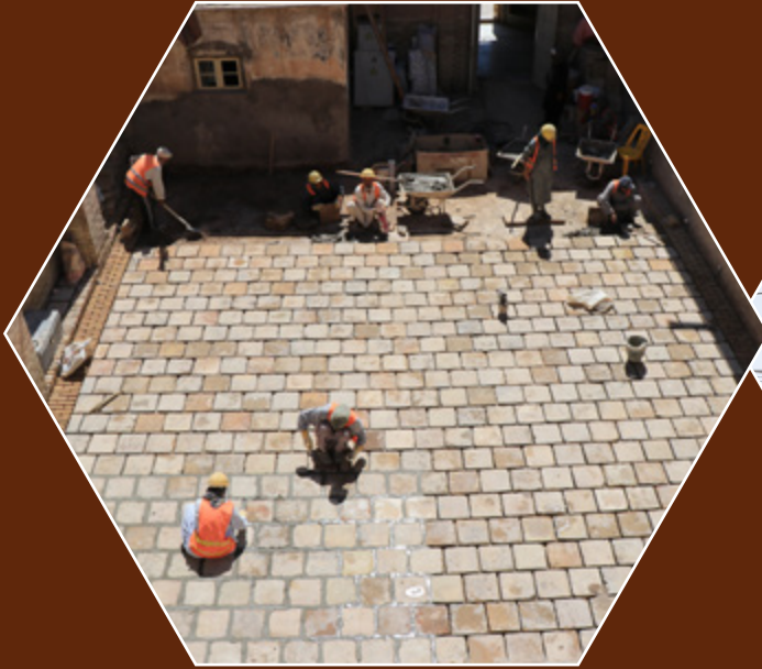
ترمیم و بازسازی مسجد جامع هرات