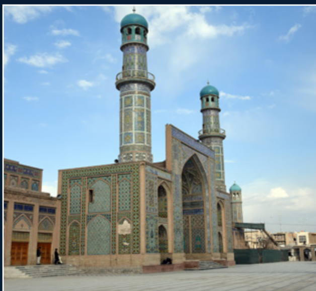
مسجد جامع هرات