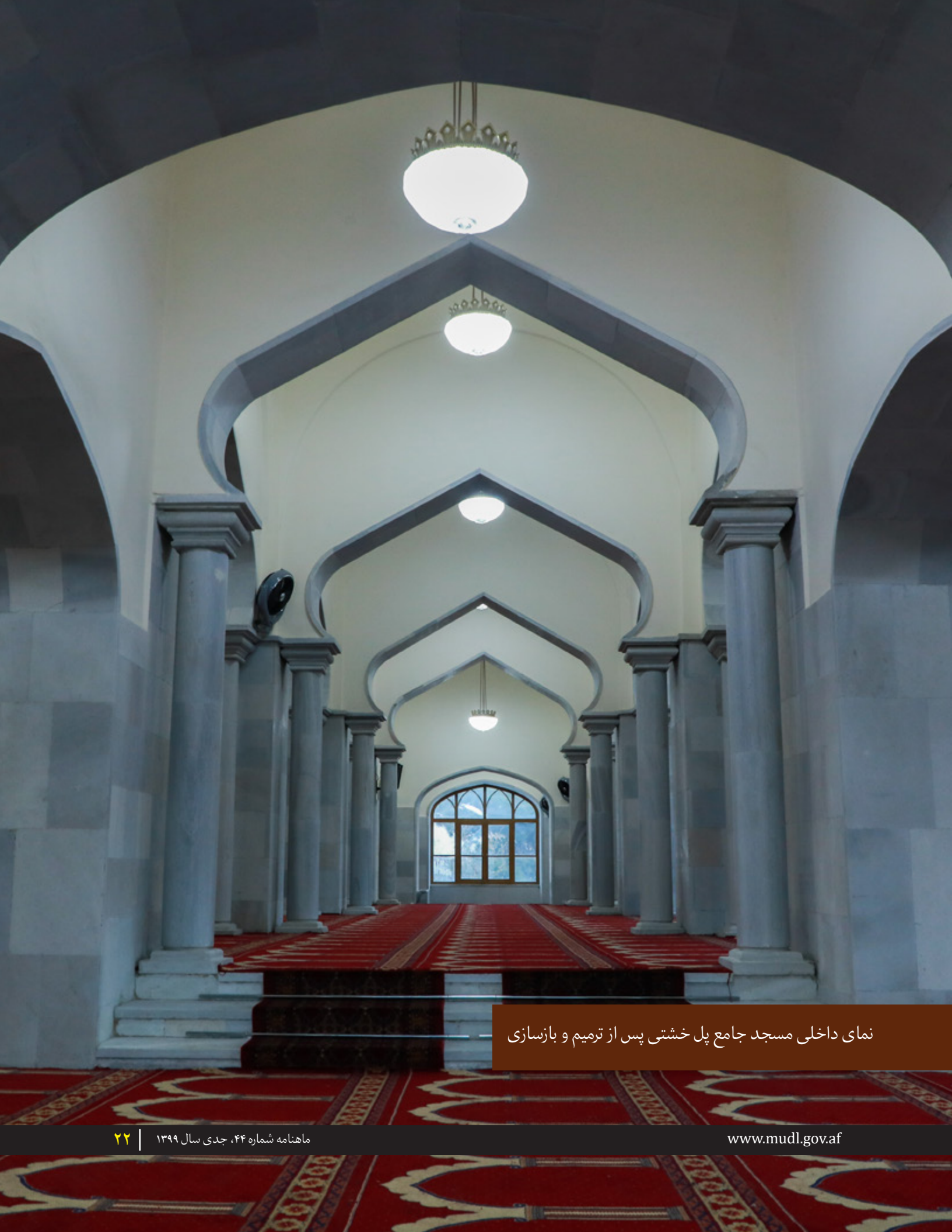
نمای داخلی مسجد جامع پل خشتی پس از ترمیم و بازسازی