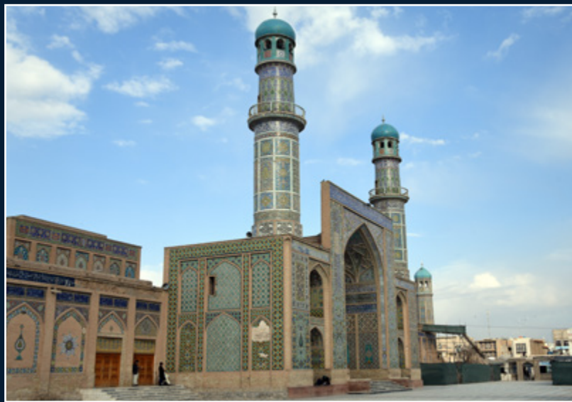
مسجد جامع هرات