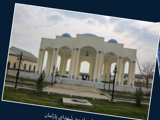
بنای یاد بود شهدای پارلمان