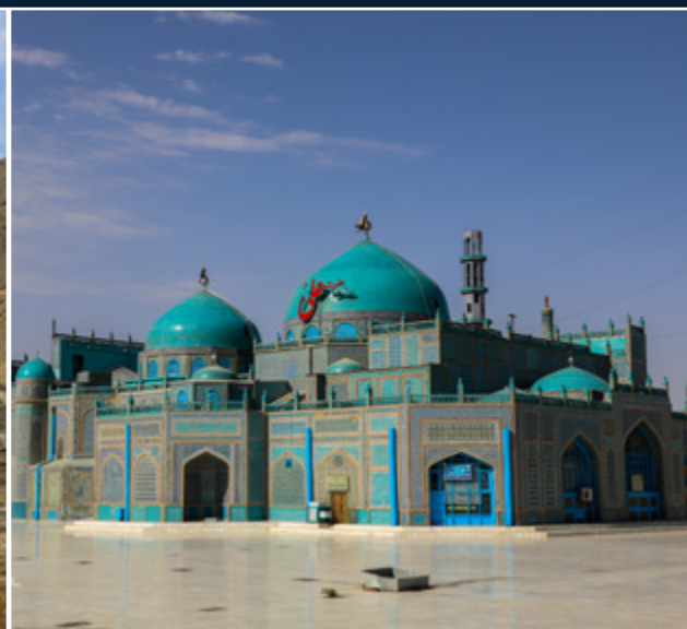
مزار مطهر حضرت علی کرم الله وجهه در شهر مزار شریف