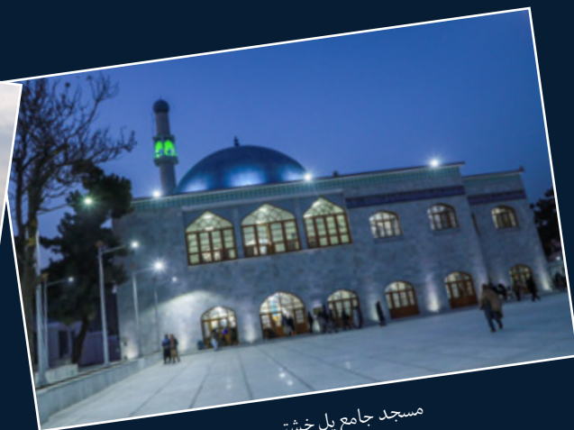
مسجد جامع پل خستی