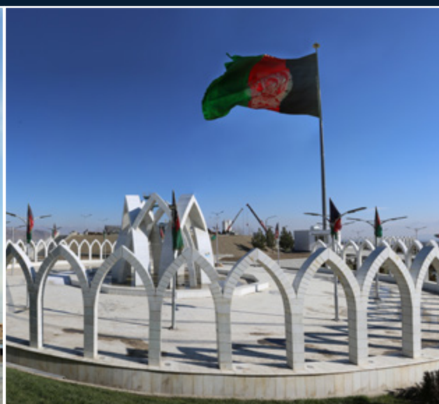
اعمار بنای بیرق یاد بود از وزیر محمد اکبر خان در تپه وزیر محمد اکبر خان