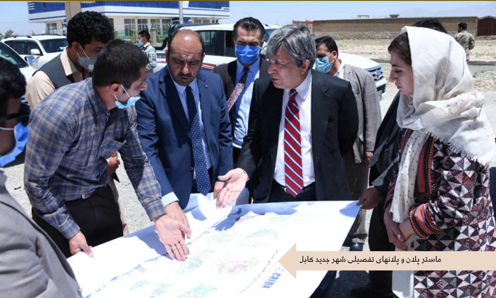
ماسټر پلان و پلانه‌های تفصیلی شهر جدید کابل

احداث شهر جدید کابل می باشد که اکنون جایگاه یکی از مهمترین پروژه های حکومت را احراز نموده است. کار تطبیق این پروژه زیربنایی که به دلیل بعضی مشکلات به تاخیر افتاده بود، اخیراً با سعی و تلاش رهبری وزارت شهر سازی و اراضی دوباره روی دست گرفته شده و قرار است هموطنان ما بزودی شاهد آغاز کار عملی احداث شهر جدید کابل در ولسوالی ده سبز با نظرداشت تمامی امکانات و سهولت های لازم شهری باشند.