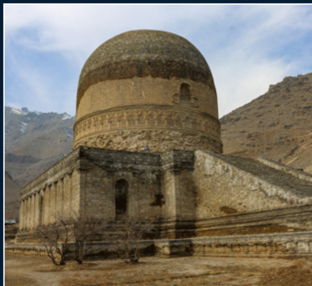
استوپه تاریخی در توپ دره ولایت پروان