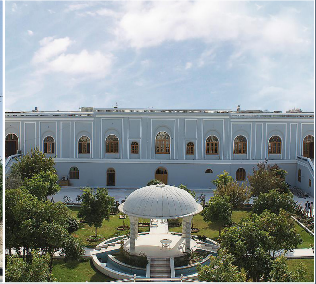
نمای از تعمیر حرم سرای در ولایت قندهار