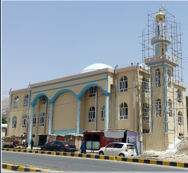
مسجد جامع و خرقة مبارک ولایت بدخشان