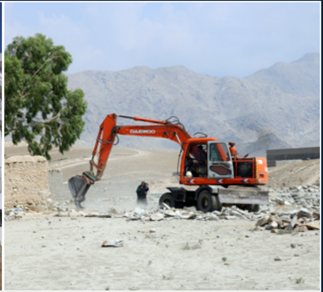
استرداد زمین های دولتی در ولایت لغمان