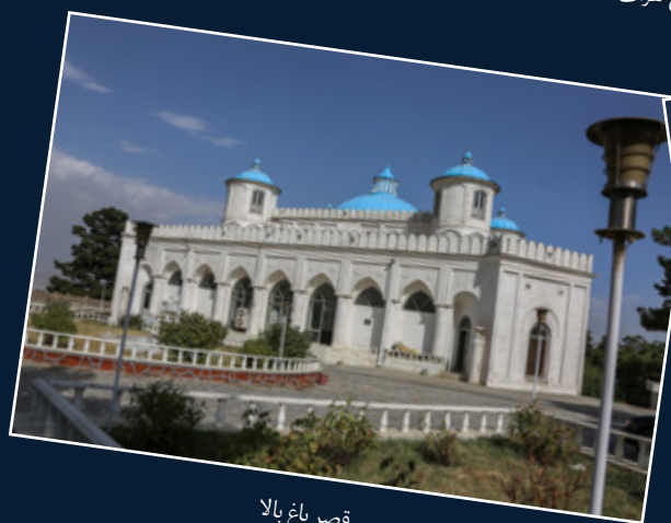
قصر باغ بالا