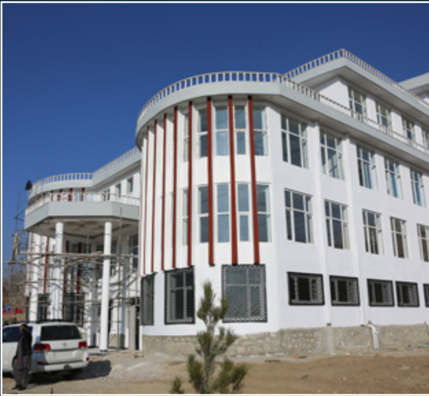
اعمار مهمان خانه مقام ولایت کاپیسا