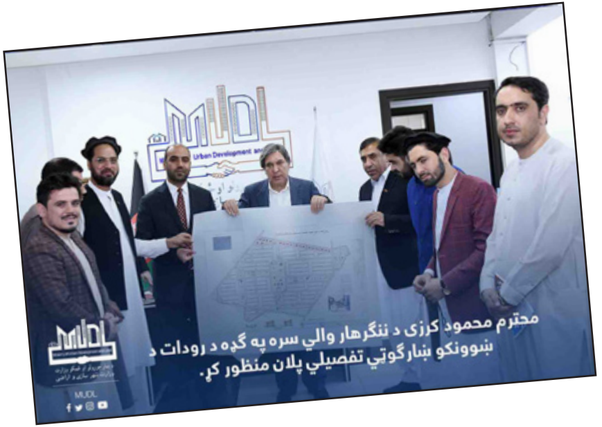
محترم محمود کرزی د ننگرهار والي سره په گډه د رودات د بڼوونکو بڼار گوټي تفصيلي پلان منظور کړ.