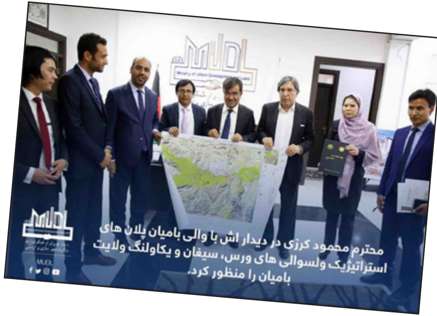
محترم محمود کرزی در دیدار اش با والی بامیان پلان های استراتژیک ولسوالی های ورس، سیقان و یکاولنگ ولایت بامیان را منظور کرد.