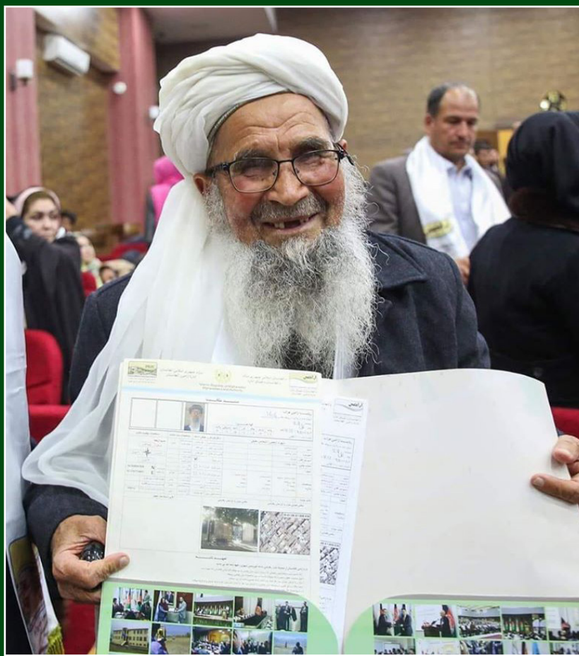
نویسنده حشمت ناصری

گرفت و آنها با یأس و با عالمی از ابهام، ترس و ناباوری به زندگی روزمره شان ادامه دادند.