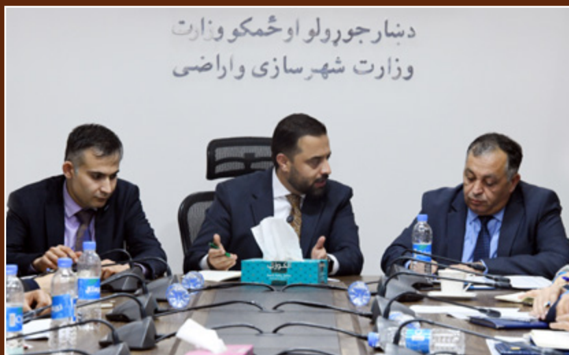
د ښار جوړولو او ځمکو وزارت وزارت شهرسازی و اراضی