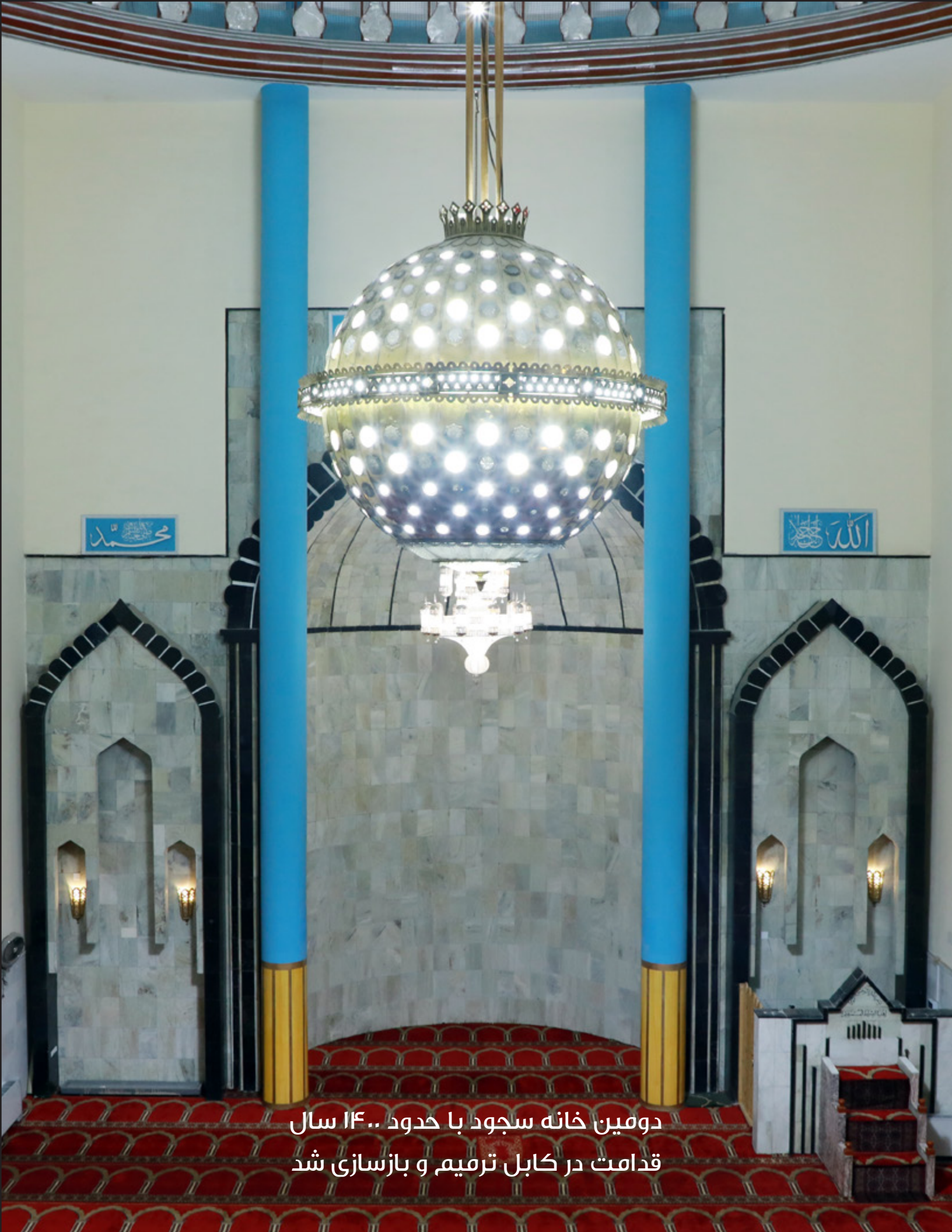
دومین خانه سجود با حدود ۱۴۰۰ سال قدامت در کابل ترمیم و بازسازی شد