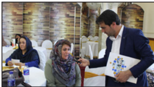
لطیفه د شپارلسمې ناحیې اوسېدونکې (خراسان بنارگوټی)

غیر رسمي بنیاري سیمو ته د ملکیت سندونو ویشل یوه ډېره بڼه پروسه ده، ځکه چې مخکې خلک په دوو کې راگیر وو چې یا به مو دولت کورونه رارنگ کړي یا به مو له دې کورونو وباسي، د ملکیت سند له ورکړې سره خلک ډاډه شول چې دا کورونه نه څوگ وپجاړوي او نه یې هم څوک ترې اخیستی شي. دا ډېره بڼه پروسه ده له دې سره ډېرې اسانتیاوې برابرېږي، خو خبره دا ده چې په دې تپه کې ډېر داسې ځایونه شته، چې په ختو کې بنویږي.