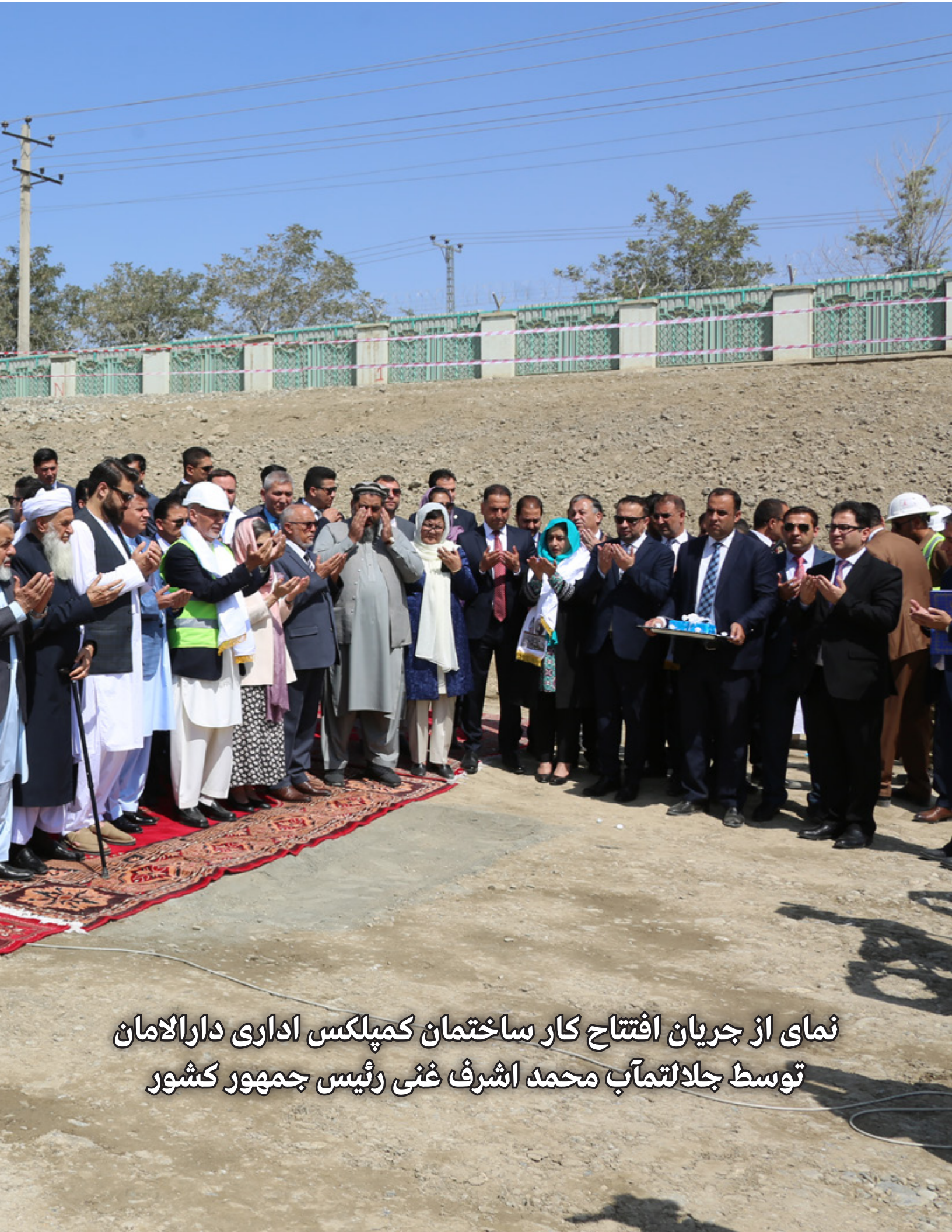
نمای از جریان افتتاح کار ساختمان کمپلکس اداری دارالامان توسط جلالتمآب محمد اشرف غنی رئیس جمهور کشور